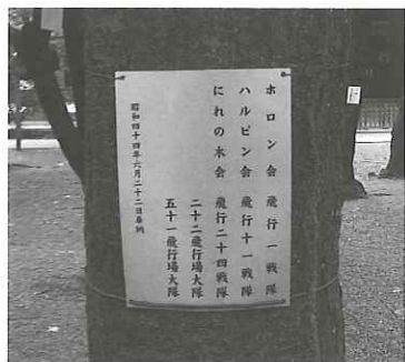
▲靖國神社外軍人紀念牌

反觀中國的老兵，他們有的在戰後三餐不飽，他們曾經以生命保護生命，以血肉抵禦槍炮，如今卻得不到足夠的援助。在某一個暗角慢慢被遺忘，消失，死去。沒有人記得他們的名字。侵華的真相，終也有時間永恆的證明，但老兵，隨着時間，可能只會永遠淡去。