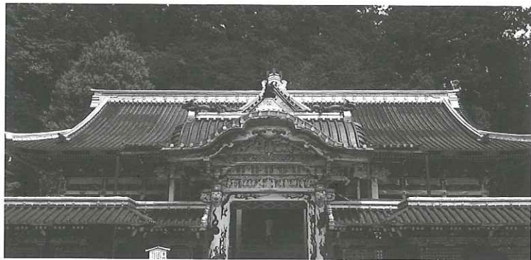
▲金碧輝煌的日光東照宮